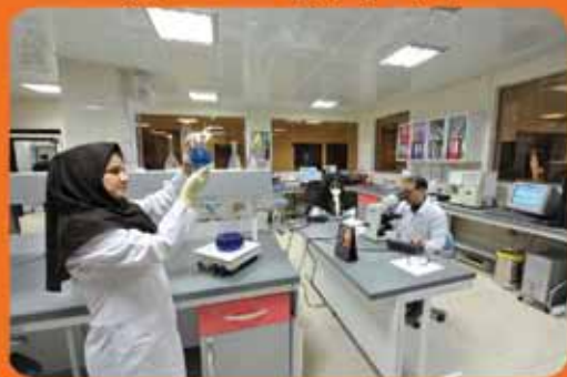
آزمایشگاه بیمارستان مرکزی صنعت نفت تهران

روابط عمومی سازمان بهداشت و درمان صنعت نفت به صورت شبانه روزی آماده دریافت هرگونه انتقاد و پیشنهاد می باشد.